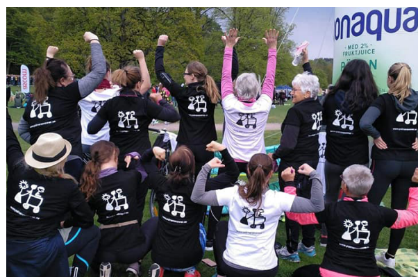
Här gänget i Göteborg, Våruset, 2019