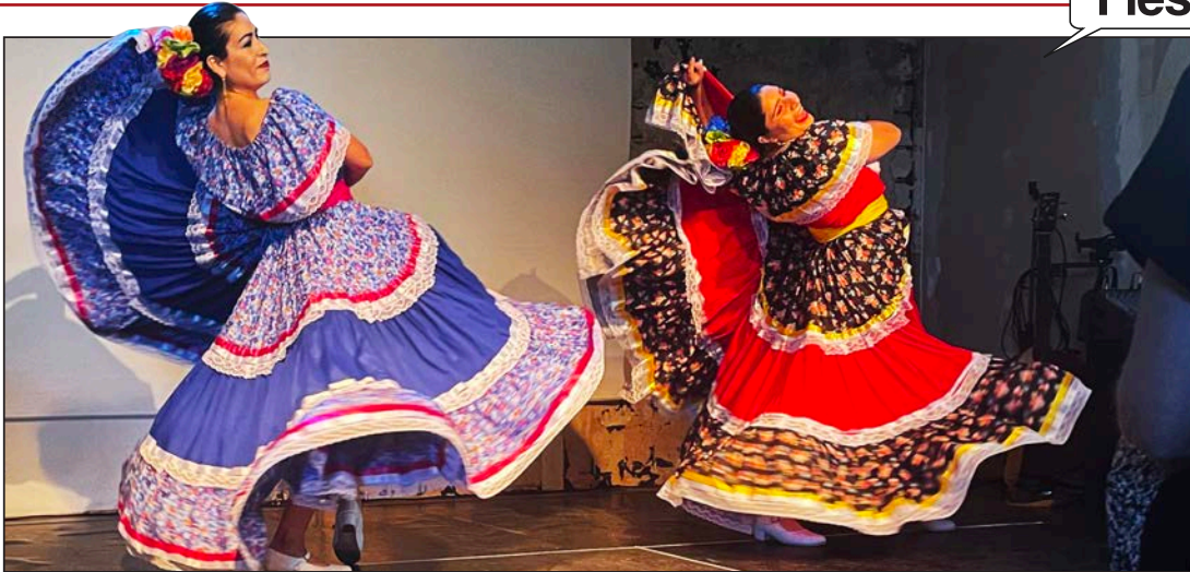
Klackarna i golvet (och även i taket) under medlemsfesten på Västkusten.