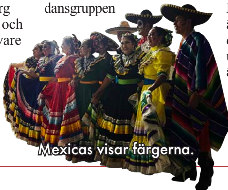
Mexicas visar färgerna.

Veckan avslutas med mexikanska folkdanser, och dansgruppen