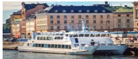
M/S Vindhem har sin kajplats nedanför Stockholms slott. Under evenemanget ligger vi still vid kaj.

Mexikansk dans kommer vi att få se och kanske prova på. Försäljning av fåglar och t-shirt m.m.